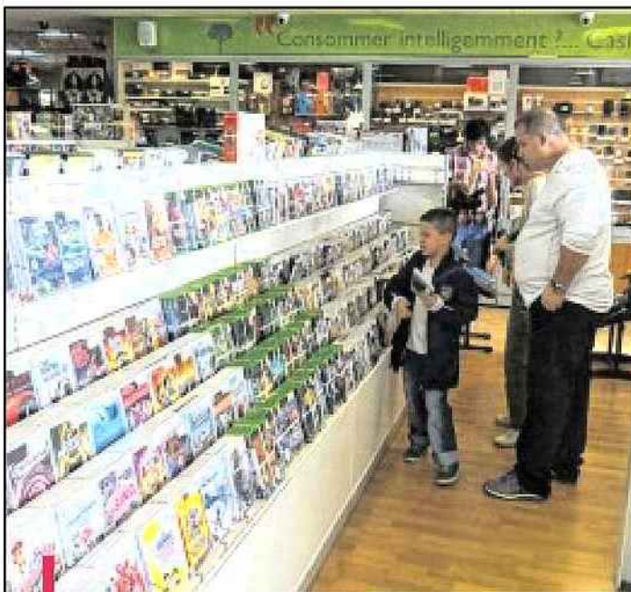
Dans les enseignes type Cash Express, il est possible de revendre ses produits et d'acheter des biens d'occasion.

Mais depuis, l'enseigne s'est modernisée, quasiment au même rythme que la technologie. À tel point qu'on y trouve aujourd'hui les derniers mobiles, les jeux vidéos sortis trois jours plus tôt, les ordinateurs derniers cris, à des prix moins élevés que pour le neuf. Et surtout, avec la possibilité de voir l'objet, de le toucher, de le tester avant de l'acheter, à la grande différence d'un produit en ligne. "C'est pour cela que les sites internet ne nous font pas de concurrence pleine et entière, poursuit