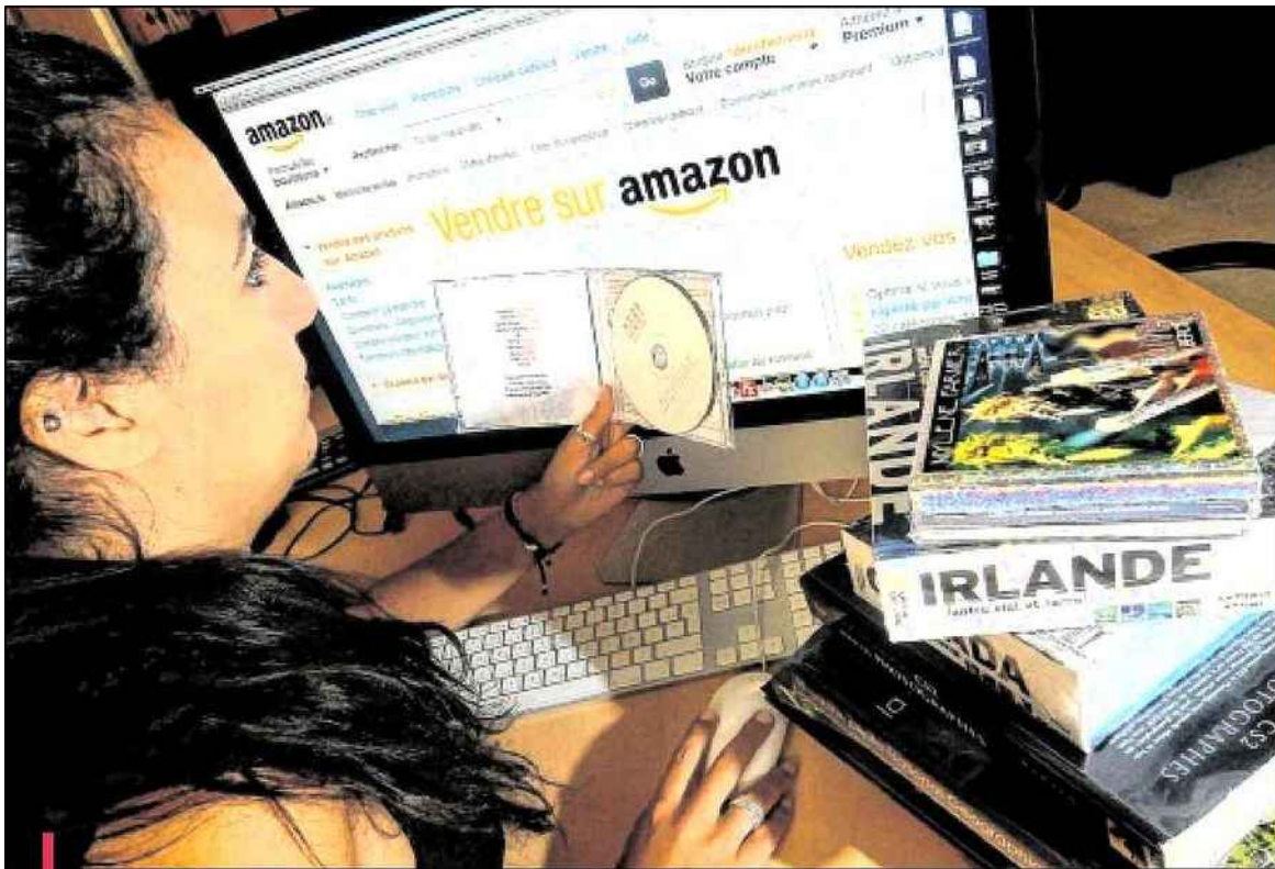
Livres, CD ou vieux jeux collecteurs... Tout un chacun négocie sur le net, sur Le Bon Coin ou le "market place" d'Amazon.

Les premiers jeux vidéo "Pacman" ou "Fifa 1998", les beaux jeux de société d'antan comme les "petits chevaux", la collection de Pif-Gadget ou les chaussures de tango de la grand-mère danseuse de ballet rangés dans un grenier ou une cave, une Juva 4 qui dort dans un garage retrouvent une valeur marchande. Et une nouvelle vie.