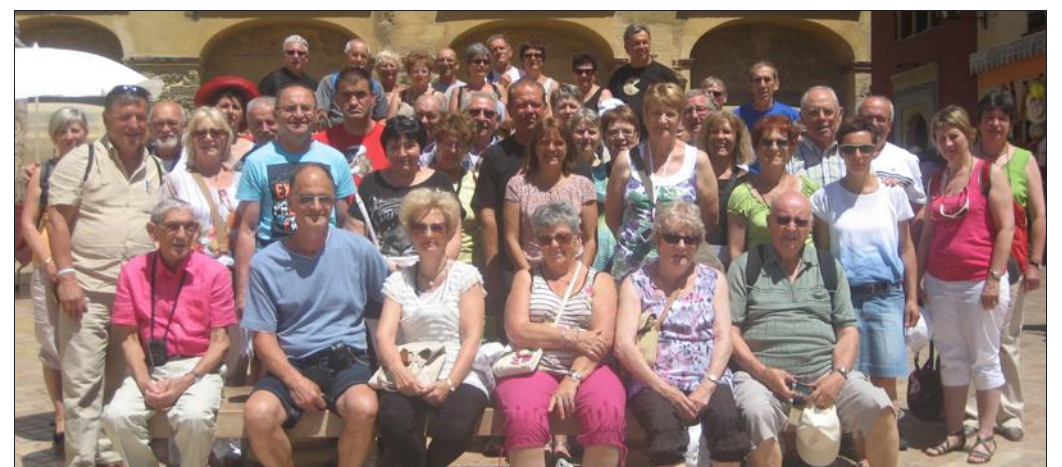
■ Découverte de l'Andalousie dans une ambiance festive.

Tous les participants sont revenus enchantés de ce périple où le flamenco fut présent lors de soirées festives, agré-