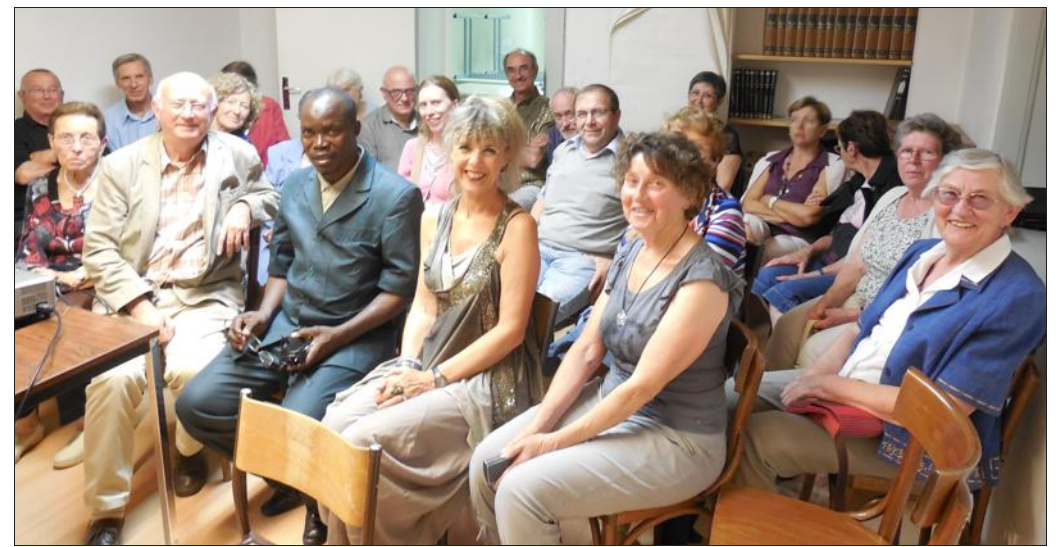
■ LACIM a décidé d'accompagner un nouveau village qui succédera à Djennina.

GAE intervient également dans l'alphabétisation et l'agriculture durable. Le comité de LACIM a décidé d'accompagner un nouveau villa-